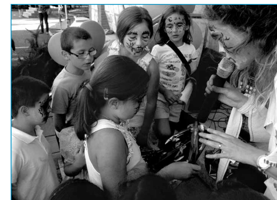
Los más pequeños disfrutaron durante toda la tarde de juegos, disfraces, animación, deportes autóctonos y de una estupenda merienda en el marco de la tradicional fiesta infantil que el Grupo ISASTUR celebró en sus instalaciones de Silvola el pasado 13 de septiembre.

Como cada año, el Grupo ISASTUR comenzó su curso escolar con la fiesta para pequeños y mayores. Y como la fecha elegida fue el viernes 13, no perdimos la ocasión de jugar con las máscaras y los disfraces para pasar unas horas “de miedo”, aunque cambiando los sustos por una hermosa tarde de sol y diversión. Camas elásticas, hinchables y juegos para todos fueron las atracciones de una