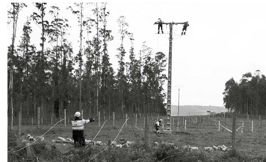
Trabajadores de ISOTRON realizando tareas de reparación en líneas de zonas rurales.

ISOTRON, la empresa de ISASTUR encargada de las reparaciones, ha visto reconocido por nuestros clientes el esfuerzo realizado.