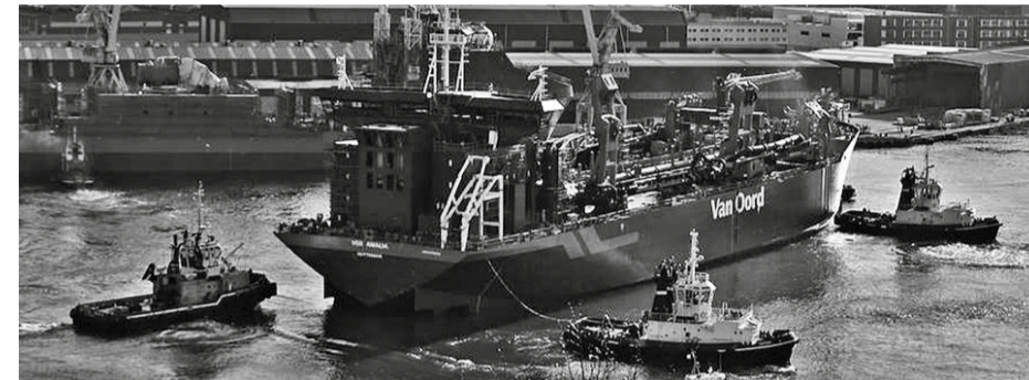
Izquierda, Personal de Babcock Montajes durante la construcción de la draga "Vox Amalia". Arriba, botadura de la draga en la ría del Nervión.

El pasado día 29 de marzo se botó en la Ría de Bilbao la draga de succión "Vox Amalia". El buque, en cuya construcción ha participado Babcock Montajes, ha sido entregado por La Naval de Sestao a la compañía holandesa Van Oord.